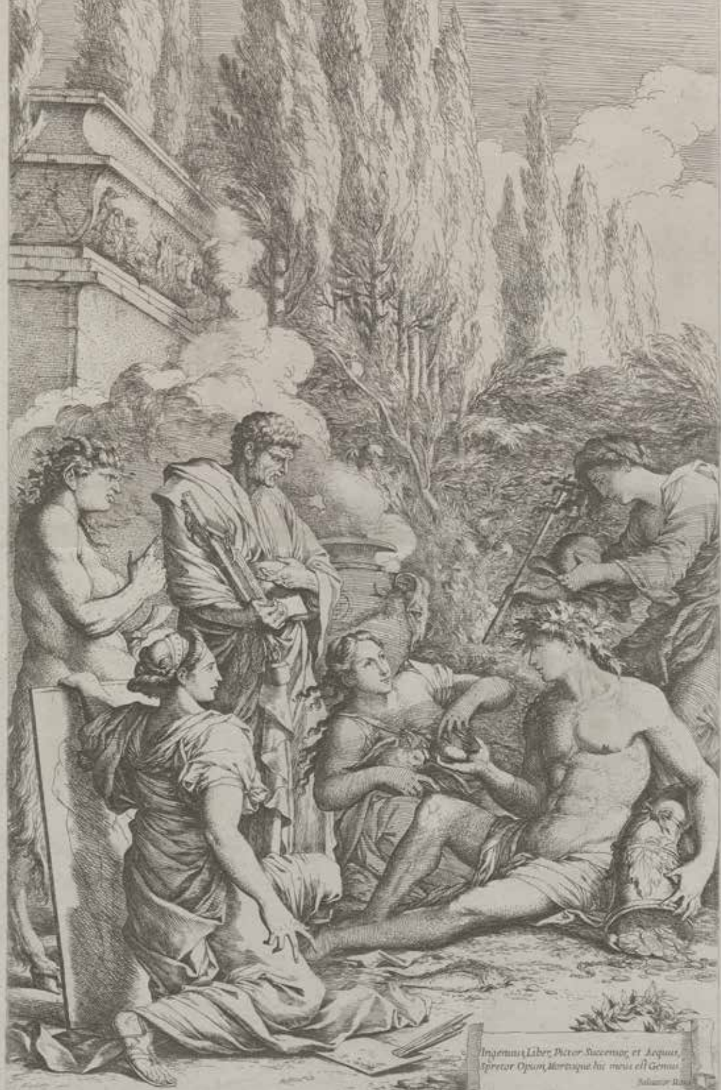
Ingenius Liber, Pictor Succentor, et Aequus, Spretor Opum, Mithrasque hic meus est Genus.